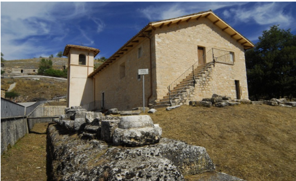
Chiesa di San Silvestro – lato sud-orientale, della scalinata d'ingresso: resti dei basamenti e delle colonne

Tra il 1920 ed il 1930 scavi condotti al di sotto della Chiesa di Villa San Silvestro, frazione montana del comune di Cascia a pochi chilometri dal confine con la provincia di Rieti, fecero riemergere sul lato nord della chiesa di San Silvestro il podio ed alcuni elementi architettonici e della decorazione di un grande tempio romano , del tipo etrusco-italico, risalente al III secolo a.C., costruito in opera quadrata con blocchi di pietra calcarea. Il podio presenta un coronamento con modanature lisce, che in alcuni punti conserva traccia dell'originaria rivestimento in stucco, destinato a dare alla pietra locale l'apparenza del marmo. L'accesso al tempio avveniva sul lato sud-orientale, rivolto verso la valle, per mezzo di una scalinata tra due avancorpi, di cui si sono rinvenute parte delle fondazioni.