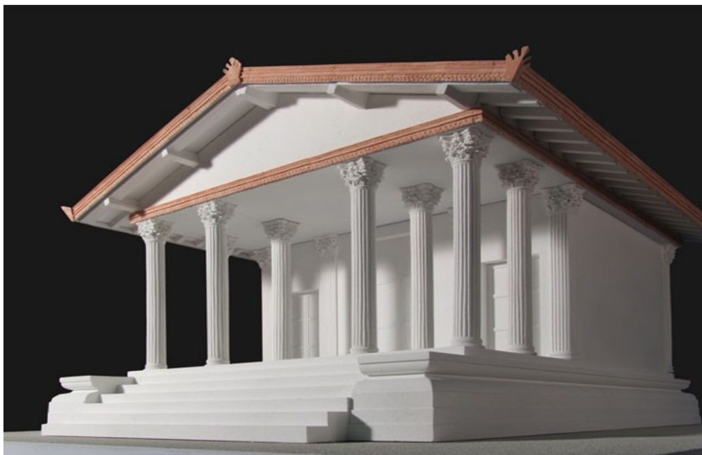
Ricostruzione del Tempio romano

Sopra il podio sorgevano una cella templare con due ali laterali: su quella centrale, più larga, di 8,20 m di larghezza, si è sovrapposta la chiesa, che ne ha riutilizzato le fondamenta. La cella doveva essere preceduta da due file di colonne che definiva un pronao profondo. Sono conservate, fuori posto, tre basi attiche in travertino di 1,30 m di diametro, che hanno permesso, sulla base delle dimensioni, di ricostruire per il tempio una facciata probabilmente tetrastila (a quattro colonne) Il tetto del tempio era rivestito da tegole in piombo, che davano un effetto dorato.