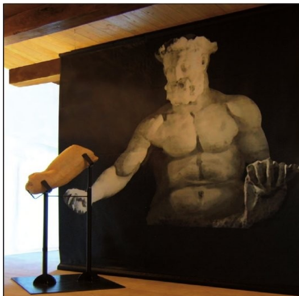
Ricostruzione della statua di Ercole in base al braccio rinvenuto.

Le strutture emerse, ancora in fase di studio, rivelano che il foro, come il tempio, ebbe diverse fasi edilizie, mentre i reperti rinvenuti mostrano che l'area fu frequentata dal III al I secolo a.C. Appare naturale collegare, dunque, la costruzione del foro con l'imporsi della dominazione di Roma (avvenuto con il console Curio Dentato nel 290 a.C.), che, per assicurarsi il controllo sul territorio, impianta un forum in un'area in cui una popolazione prevalentemente di agricoltori e allevatori viveva sparsa sul territorio e lontana da ogni città, per farvi svolgere tutte le attività pubbliche, civili e religiose, che altrimenti non avrebbero avuto un punto di aggregazione ben definito.