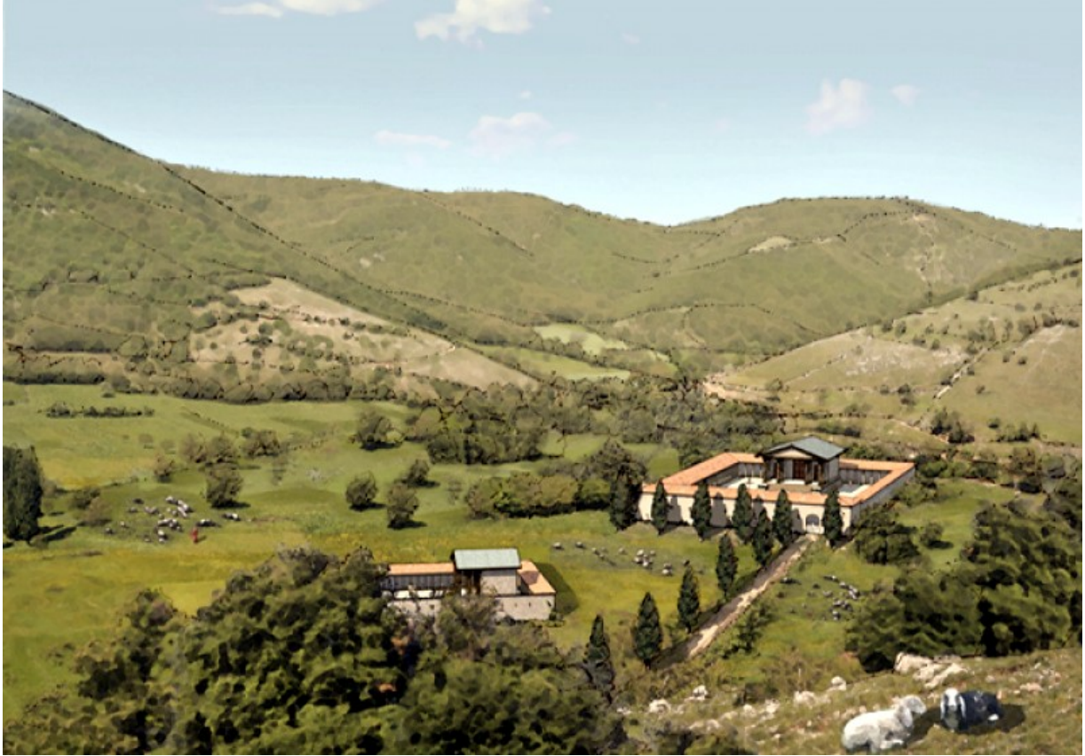
Ricostruzione dell'area archeologica con i templi ed il foro come poteva apparire nel I sec a C.

A Est del foro, sempre in seguito agli scavi del 2007, è emersa una vasta area delimitata da una tripla serie di portici, scanditi da colonne in laterizio e semipilastrini, al centro della quale è apparsa una struttura rettangolare, probabilmente un tempio a doppia cella, dedicato, quindi, ad una coppia di divinità. Oltre alle particolari caratteristiche legate al tipo stesso di costruzione e di suddivisione degli spazi, appare notevole il fatto che questo settore non venga abbandonato, come invece accaduto per il foro, ma che attesti una frequentazione ancora in età longobarda, come dimostrano due tombe, probabilmente dell'epoca, venute alla luce durante gli scavi.