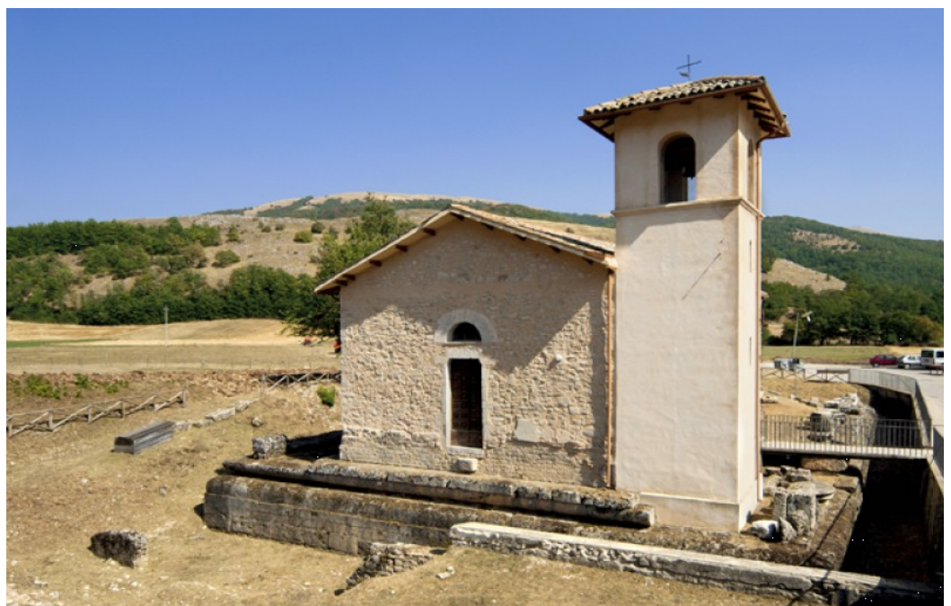
Chiesa di San Silvestro lato nord: podio e basamenti del tempio