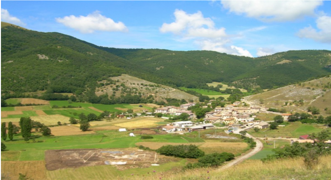
Area degli scavi: a destra della strada si vede la Chiesa rettangolare di San Silvestro, dove sono situati i resti del tempio principale: la linea rossa delimita il forum con portico; in primo piano gli scavi del 2006-2008 che hanno messo alla luce due templi con portico e altre strutture.

Il progetto è ripartito dallo studio dello stesso tempio ed i risultati sono stati sorprendenti. Da un lato lo scavo ed i rilievi mettevano in evidenza che il tempio aveva avuto due fasi edilizie (entrambe molto ricche), con la costruzione agli inizi del III secolo a.C., poco dopo la conquista romana della Sabina, ed una ristrutturazione in forme ancora più monumentali ed ispirate a modelli architettonici presenti nella stessa Roma agli inizi del I secolo a.C., probabilmente a seguito di un grande terremoto avvenuto nel 99 a.C. D'altro lato, l'analisi congiunta dei risultati delle prospezioni e delle foto dell'area dimostravano la fondatezza di una delle ipotesi di partenza: un tempio così grande (30 x 20 m) non poteva sorgere isolato in mezzo a questa pianura a 1000 m di altezza, ma doveva far parte di un complesso molto più vasto ed articolato.