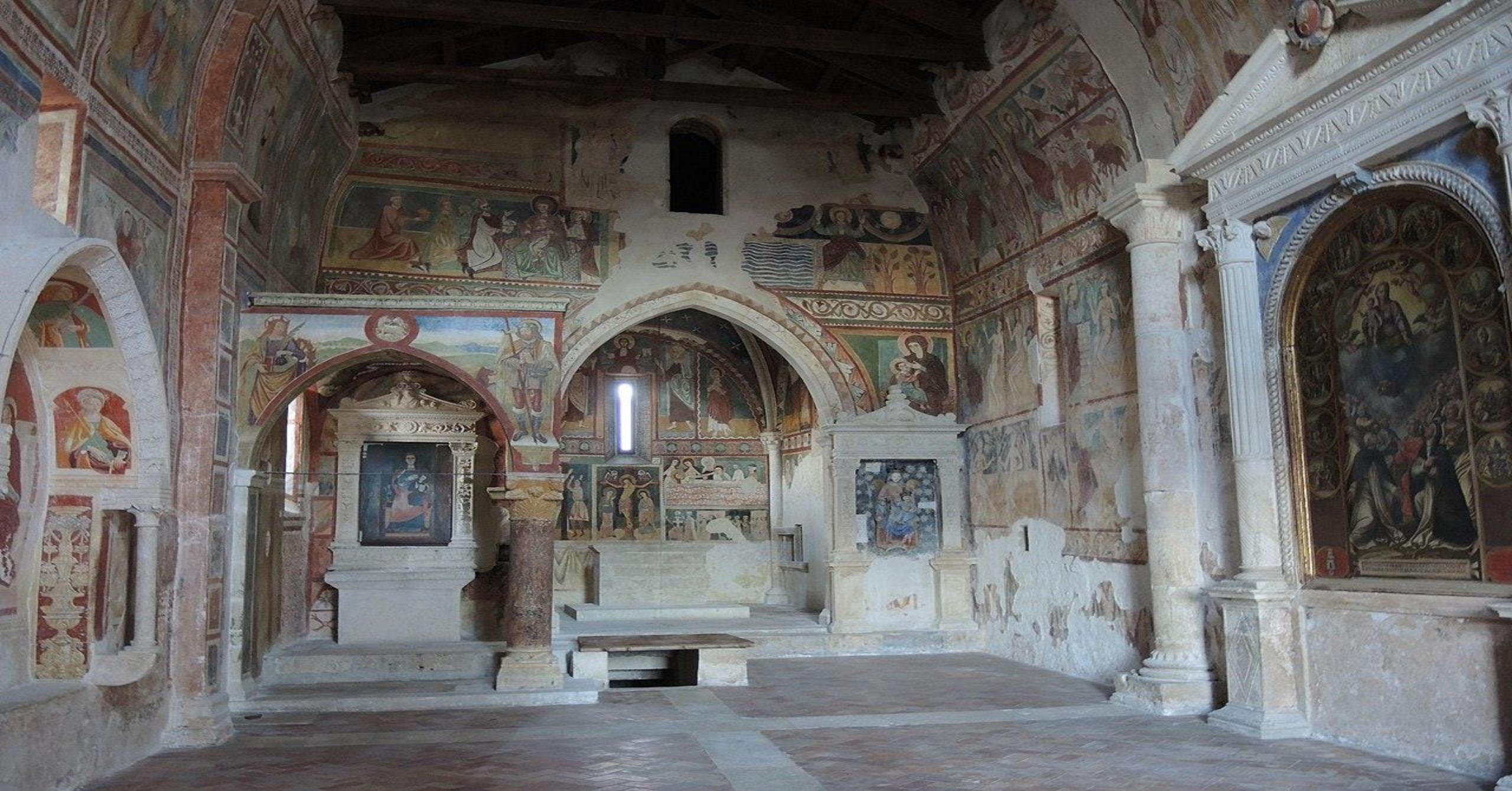
Fossa – Chiesa di S. Maria ad Cryptas