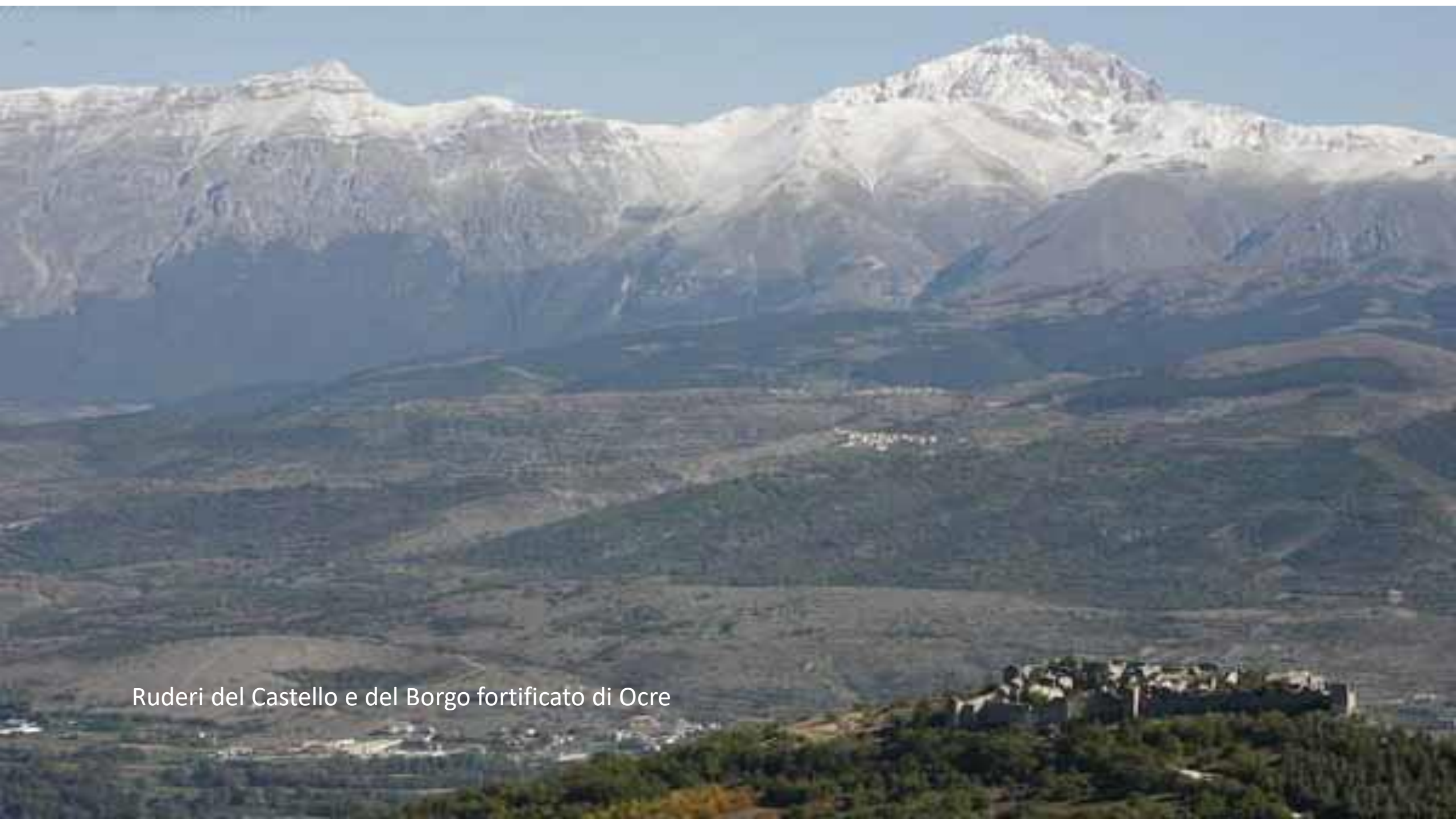
Ruderi del Castello e del Borgo fortificato di Ocre