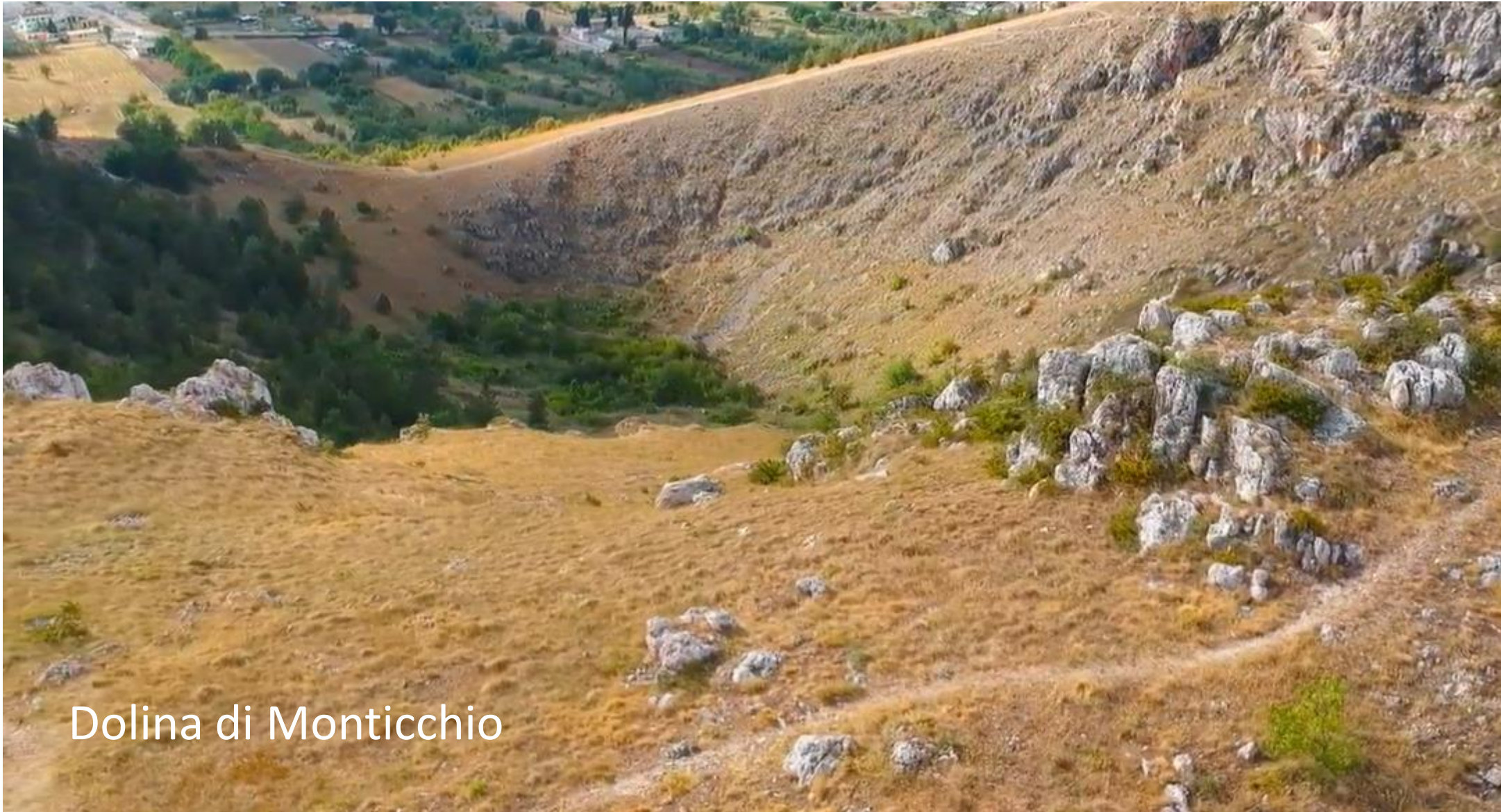
Dolina di Monticchio