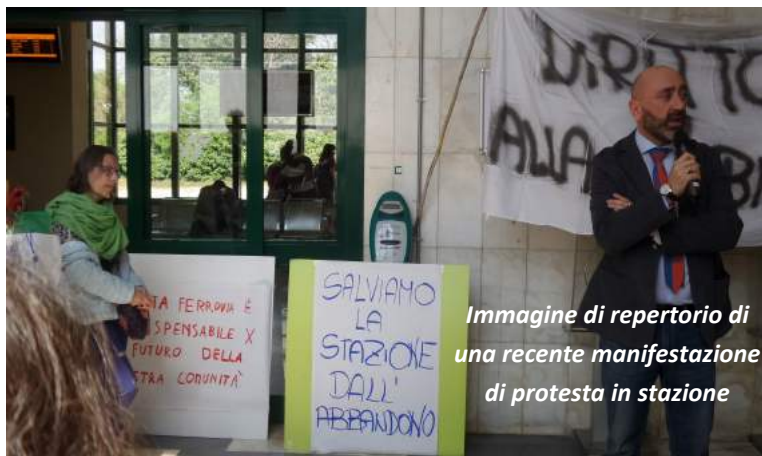
Immagine di repertorio di una recente manifestazione di protesta in stazione

Sull’ottica di contemplare l’inserimento della